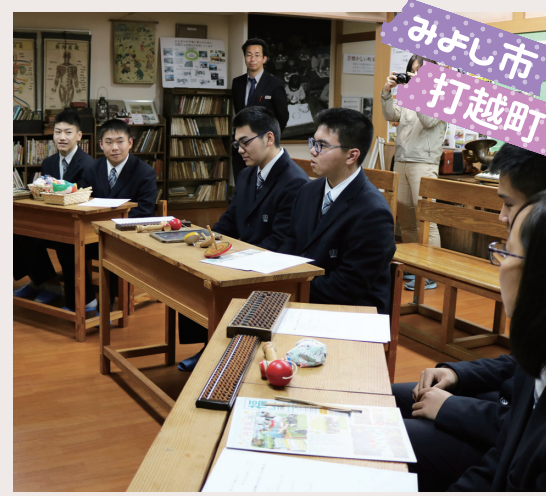
メンコやゴム跳びの遊び方を教えてもらいました