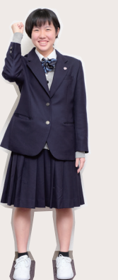
今まで実習で行った施設と違いがありました