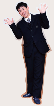
いろいろな人と関わることの楽しさを知った施設訪問