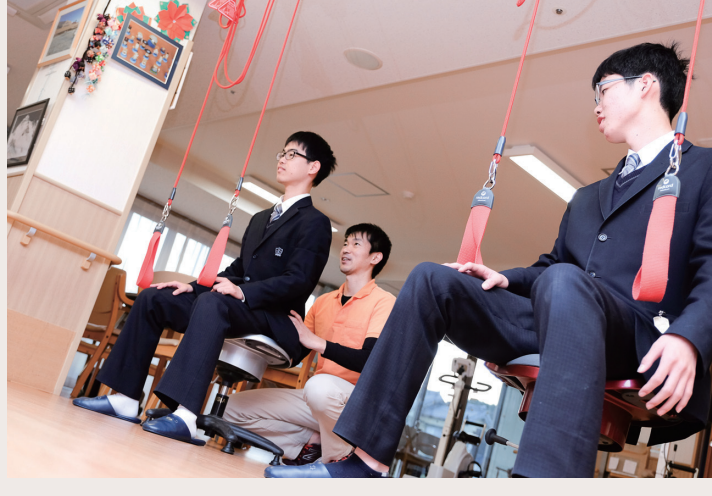
久しぶりのボランティア